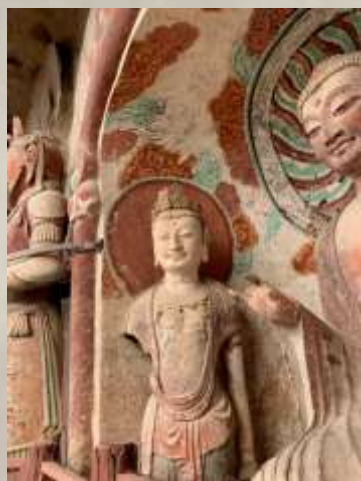
5窟3龕 露齿莞尔一笑的菩萨