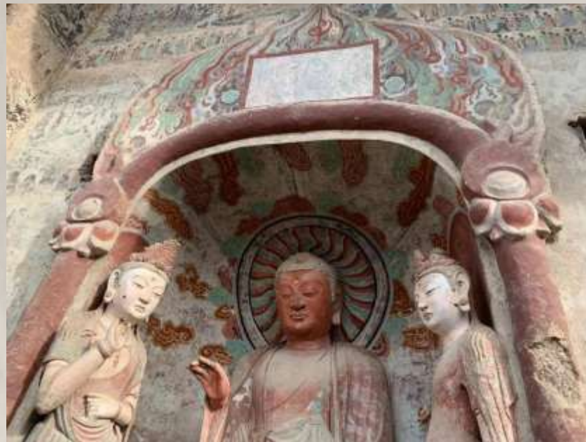
右龕迦叶佛，身高2.05米。僧衣三重：内着僧祇支，中衣为双领下垂式，外衣为斜披袈裟，结跏趺坐于方形座上。左手抚膝，手指向下做降魔印；右手举于肩部，掌心向外，手指向上，做施无畏印。

左右两龕胁侍菩萨共4身，均高2.65米，头戴华鬘冠，发披两肩。面目端丽，体态妖娆。胸部半袒，双臂外露。胸佩璎珞项圈，臂饰钏，腕戴环。肩搭帔帛或横于膝际一道，或绕臂下垂，系翻腰羊肠大裙，跣足站在圆形台座上。菩萨姿态、服饰有别，但总体风格相同。