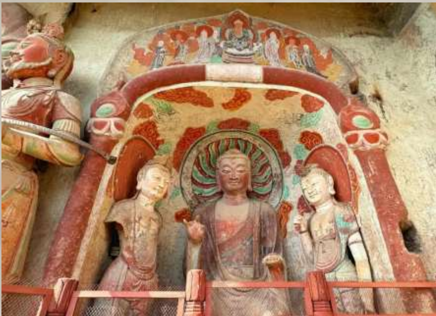
左右两龕二坐佛。左龕弥勒佛，身高3.00米。内着僧祇支，外披双领下垂袈装，腰间束带作结。两手屈肘向前，一高一低，手指残损，善跏趺坐于方形座上，脚踩仰莲台座。

左右两龕胁侍菩萨共4身，均高2.65米，头戴华鬘冠，发披两肩。面目端丽，体态妖娆。胸部半袒，双臂外露。胸佩璎珞项圈，臂饰钏，腕戴环。肩搭帔帛或横于膝际一道，或绕臂下垂，系翻腰羊肠大裙，跣足站在圆形台座上。菩萨姿态、服饰有别，但总体风格相同。